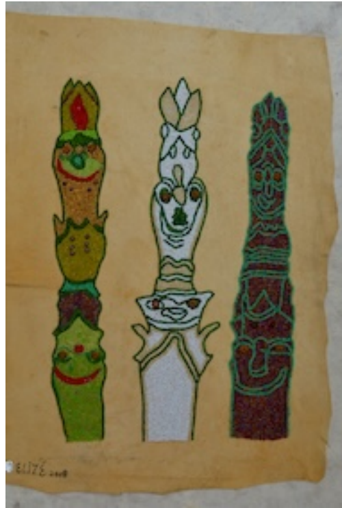
SJAMAAN 2018 KASTANJETAKKEN (Chestnut Twigs) 2018