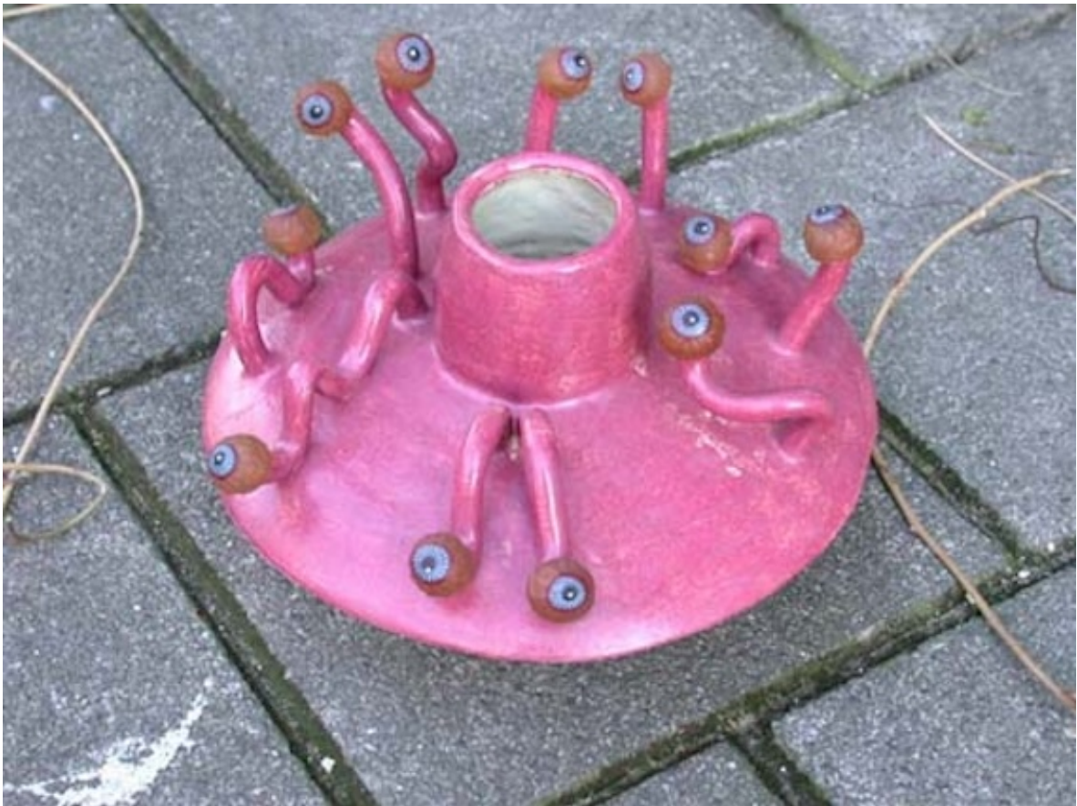
STRAAT ANEMOON (Street Anemone) 2002