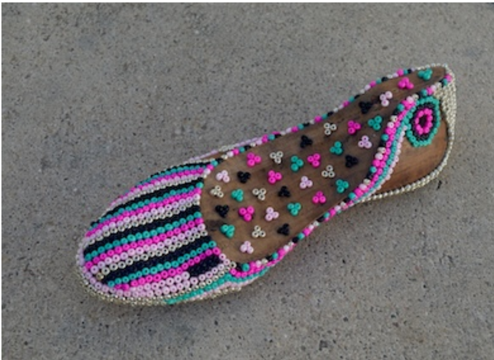
SCHOEN OP MAAT (Custom Shoe) 2017