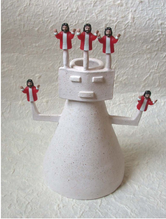
INCA JEZUS 2007