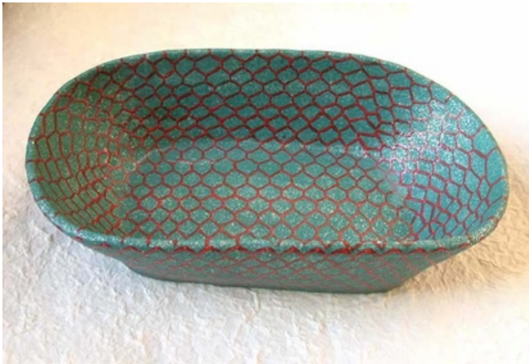
WESPENSCHAAL (Wasp Dish) 2005