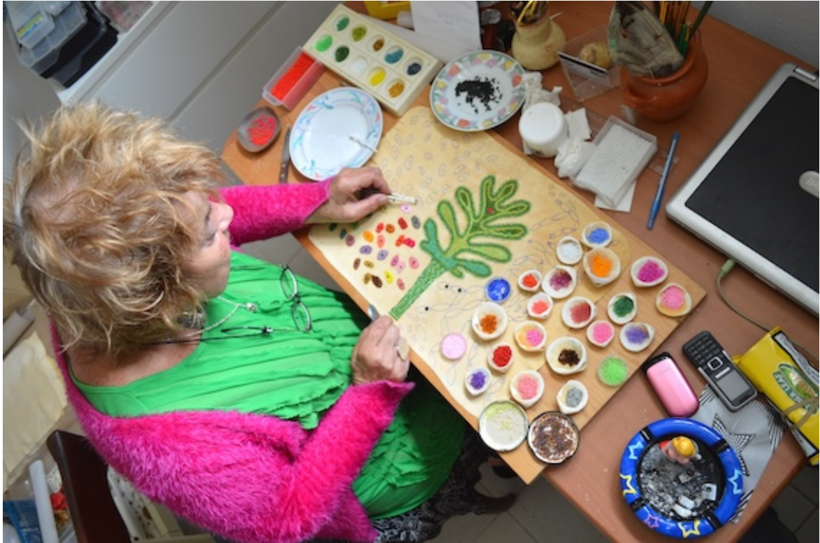
Atelier Tavarede, Portugal 2015