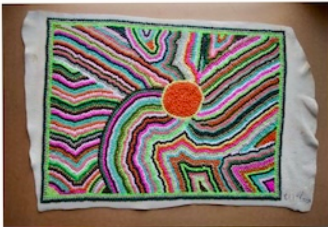
HOMMAGE AAN VICTOR BRAUNER 2020 ALCHERINGA 2020