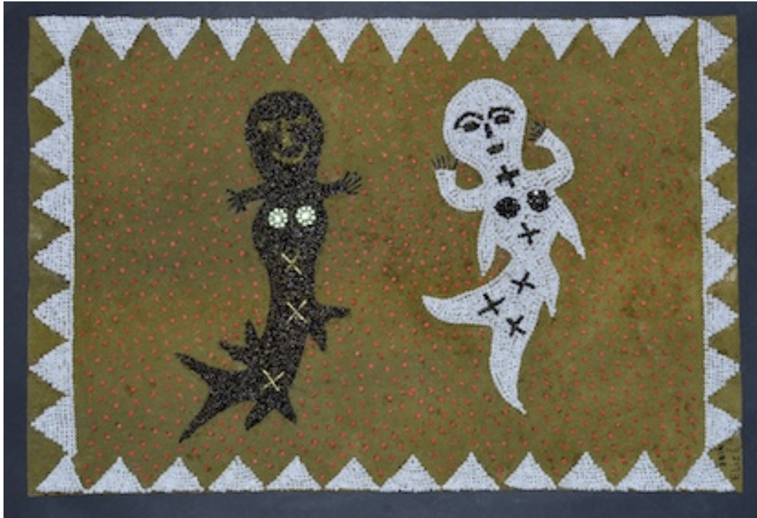
LOAS - ZEEMEERMINNEN (Lioas - Mermaids) 2016