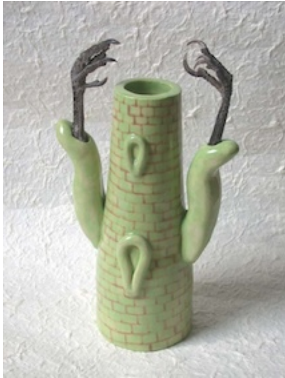
SANTERIA 2006 KLAUWENTOREN (Claw Tower) 2006