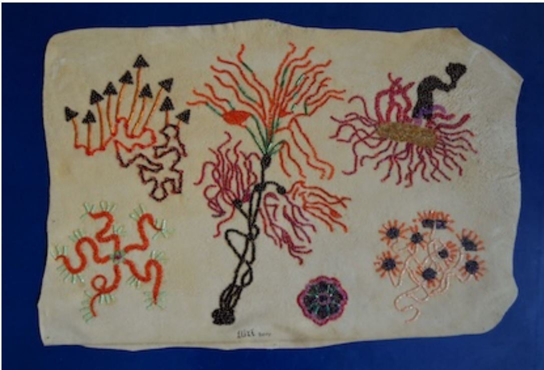
OP HET KORAALRIF (On the Coral Reef) 2014