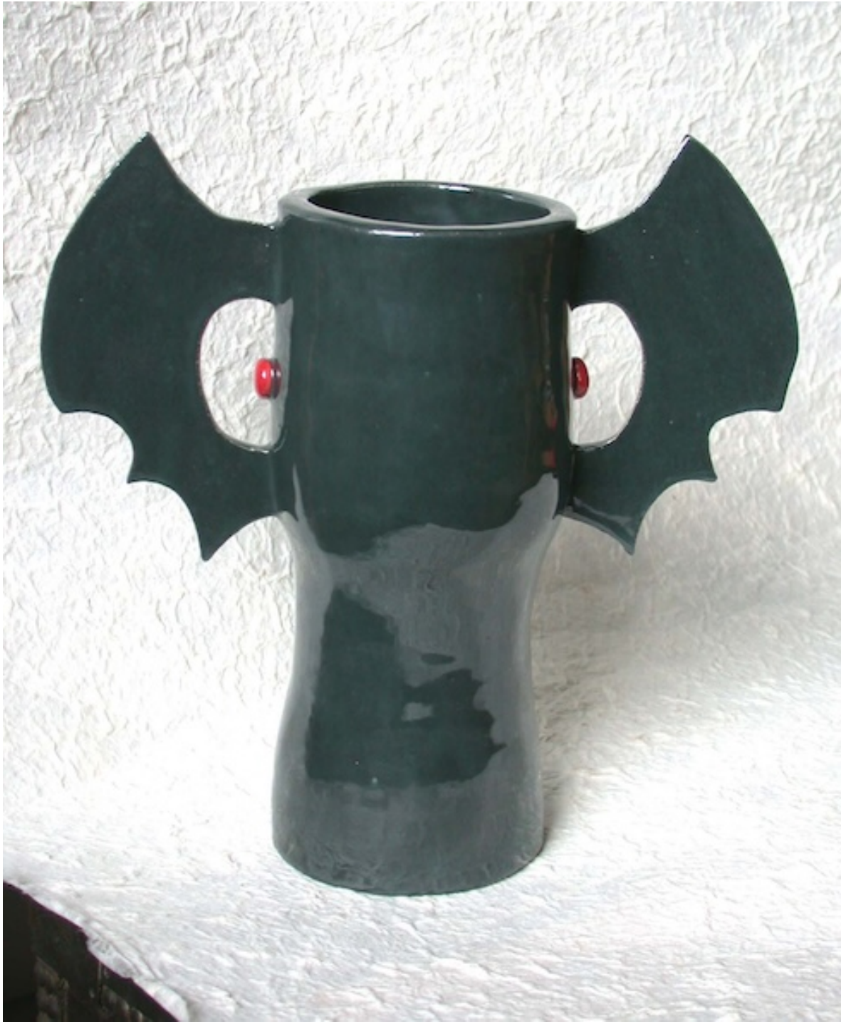
VLEERMUIS (Bat) 2005