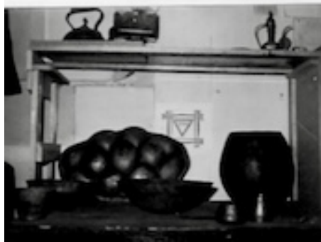
Atelier Sloot-straat Amsterdam 1973