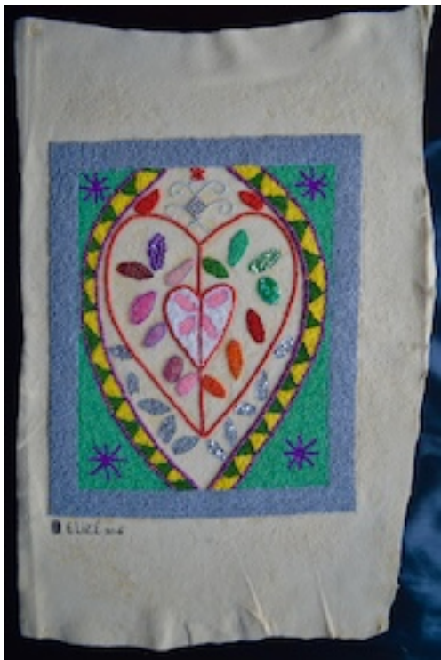
ERZULI 2016 CARNAVAL 2016