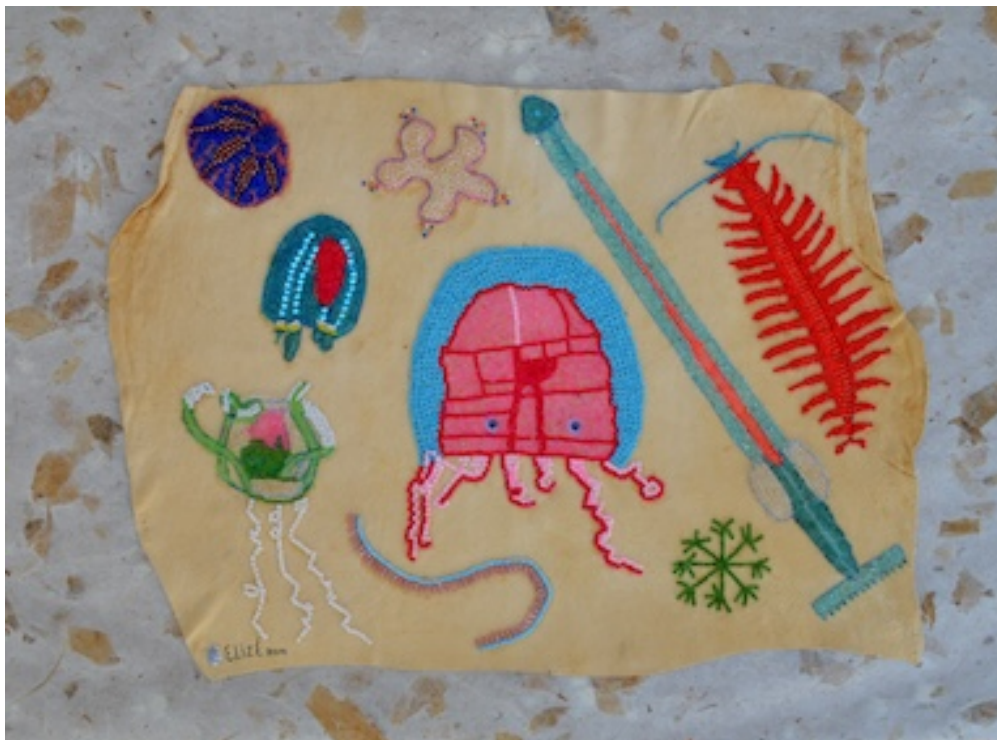
KWALLEBALLE ("Yellyfishy") 2014