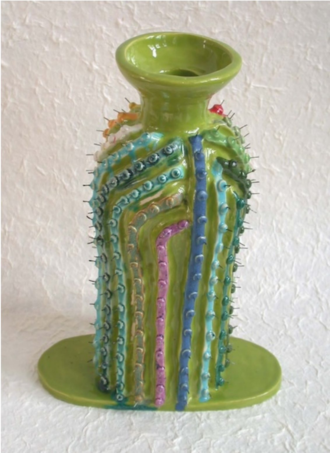
CACTUS REGENBOOG (Cactus Rainbow)2006