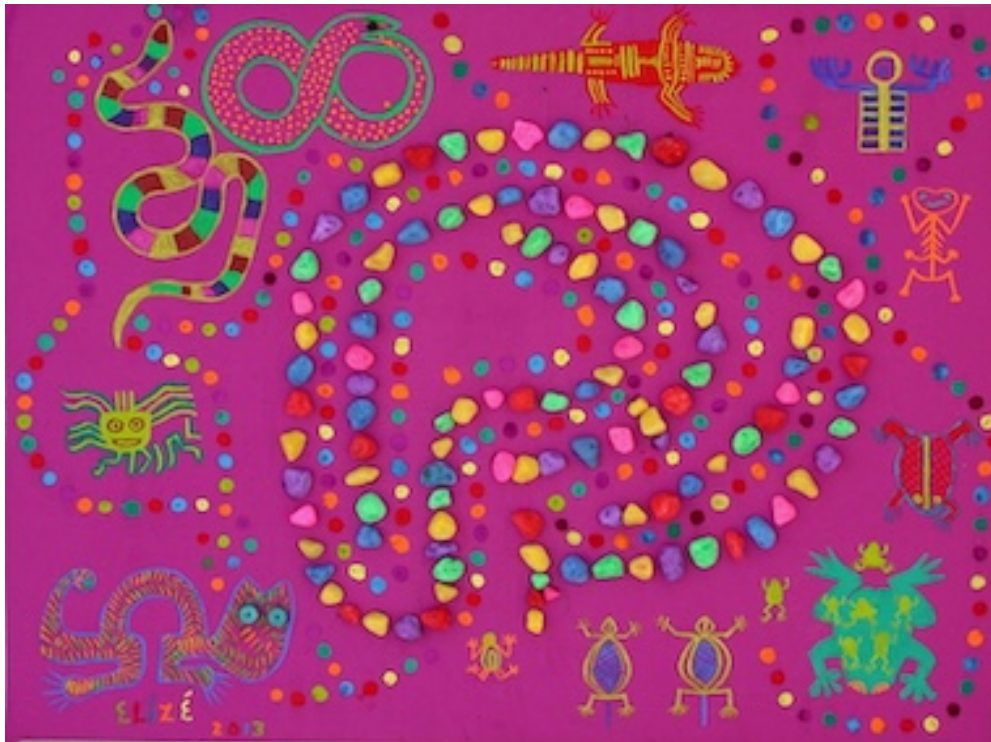
DIEREN ROND HET DOOLHOF (Animals around the Labyrinth) 2013