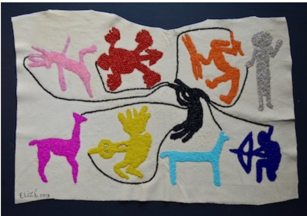
ATACAMA SJAMANEN 2019