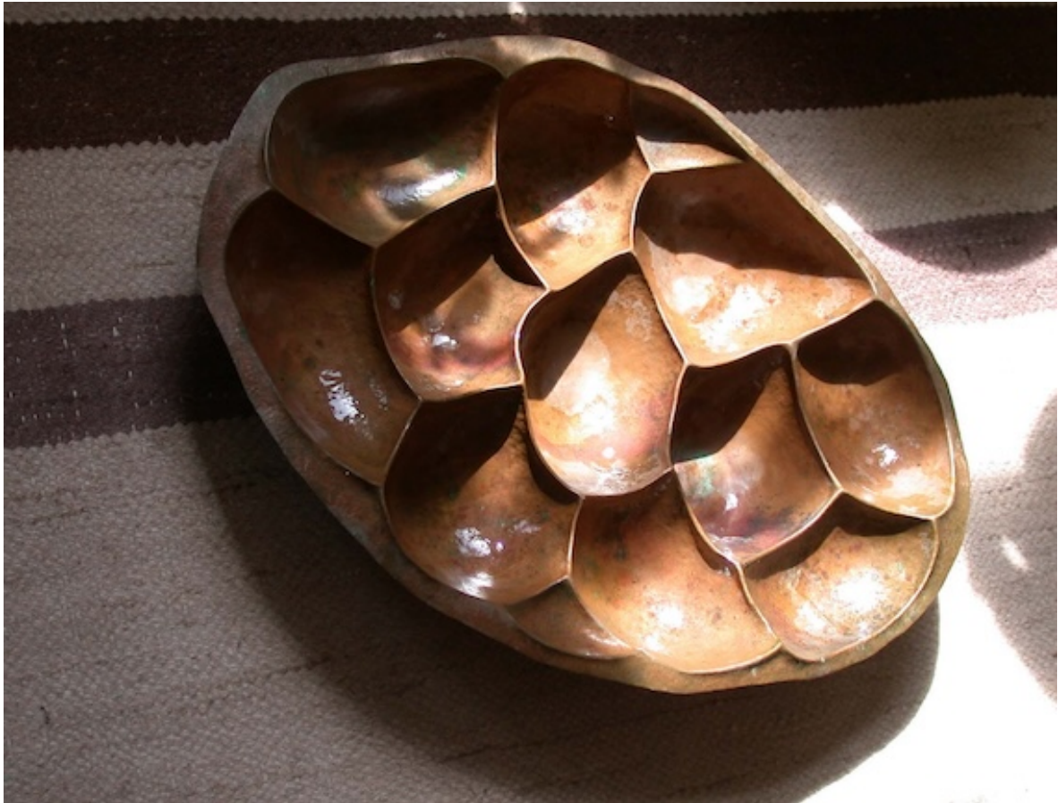
SCHILDPAAD SCHAAL (Turtle Dish) 1974