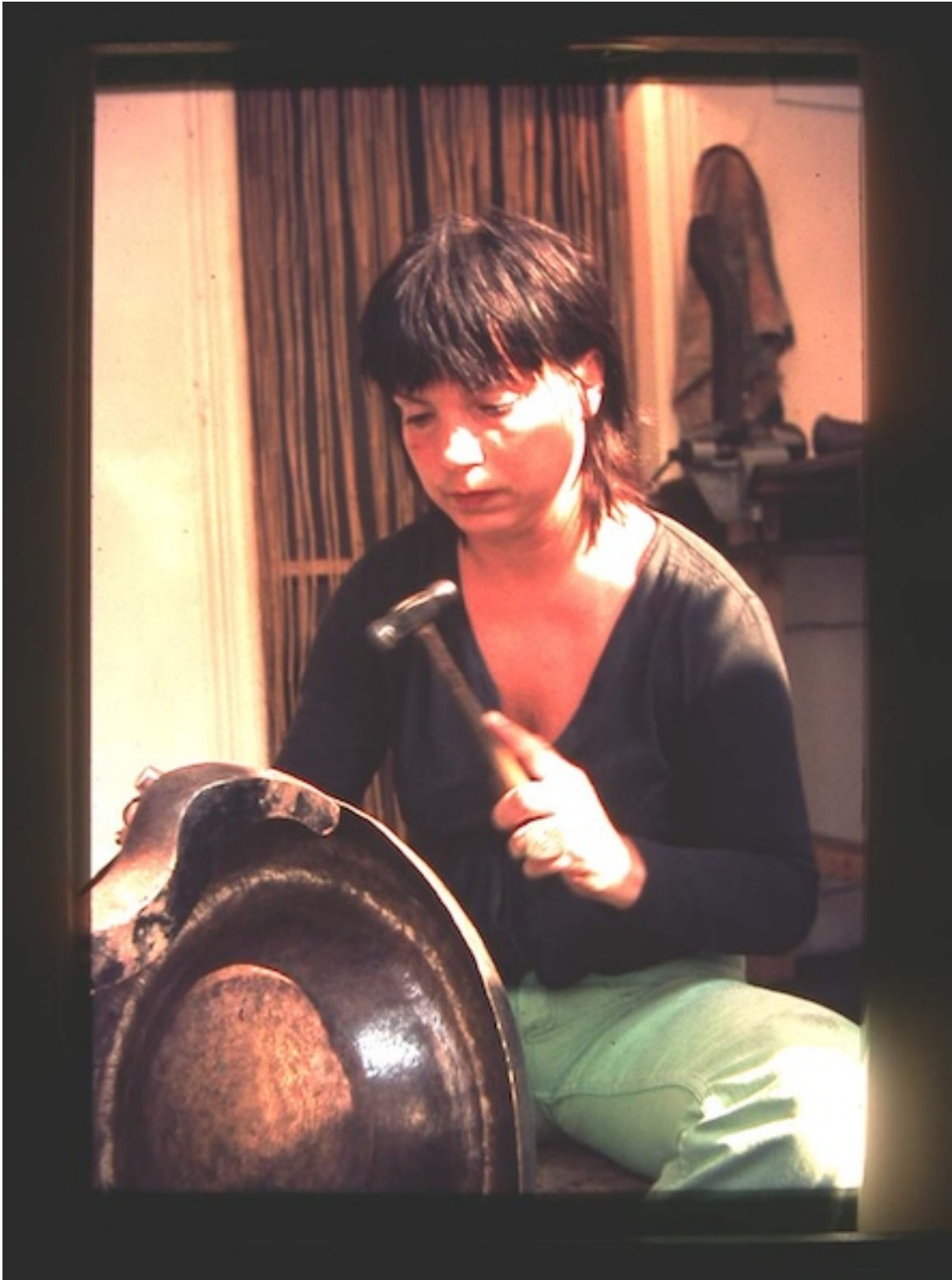
Atelier Sloopstraat, Amsterdam 1974