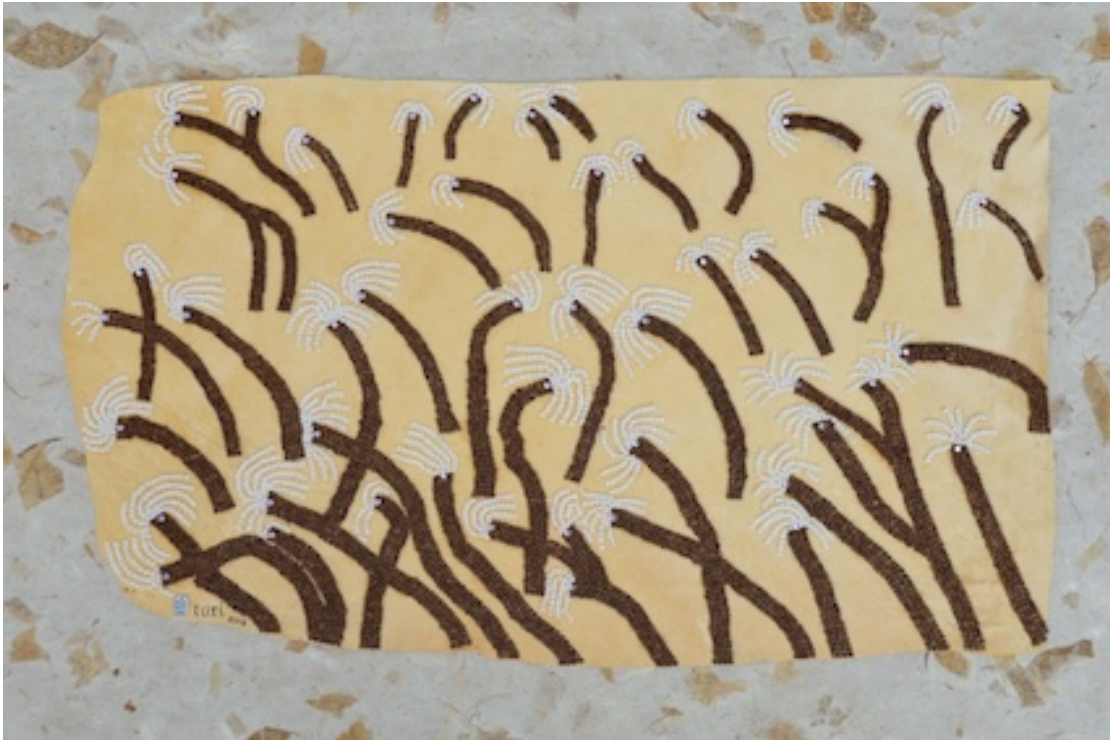
DIEPZEE WORMEN (Garden Eels) 2014