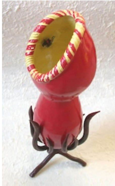
BIDSPRINKHAAN (Praying Mantis)2005 VLEESETENDE VAAS (Carnivorous vase) 2005