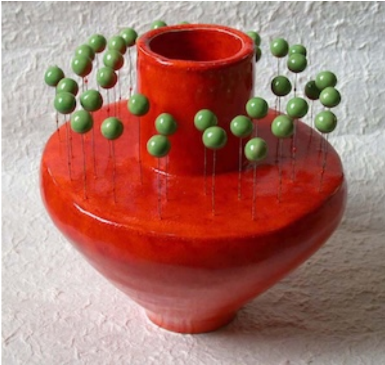
VLIEGEN EITJES (Fly Eggs) 2005