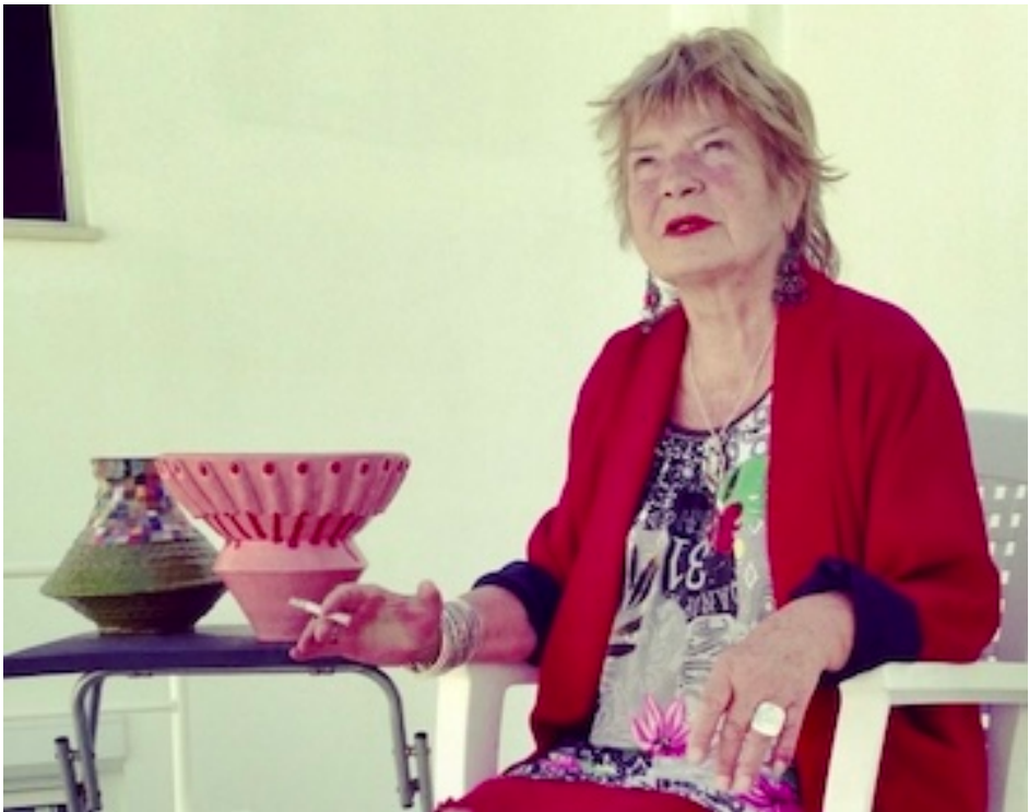
Atelier Tavarede, Portugal 2013