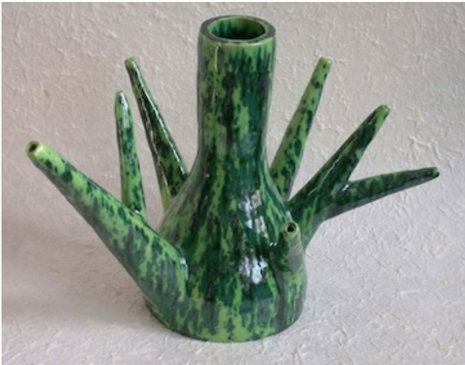
WORTELSTOK (Roots) 2006