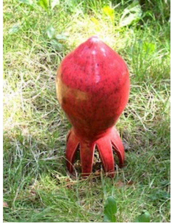
VLAMMETJES VAAS Little Flaming Vase) 2003 TUIN OCTOPUS (Garden Octopus) 2003