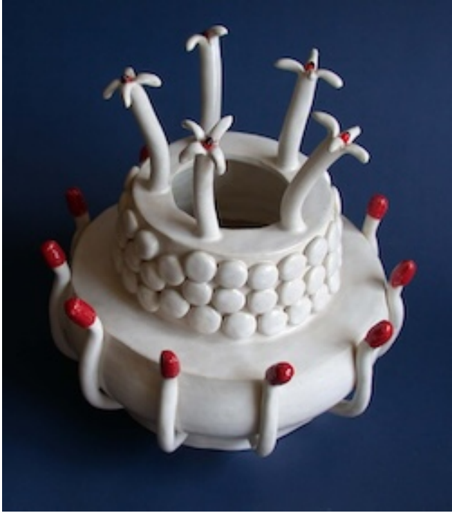
SNEEUWPALM (Snow Palm) 2010