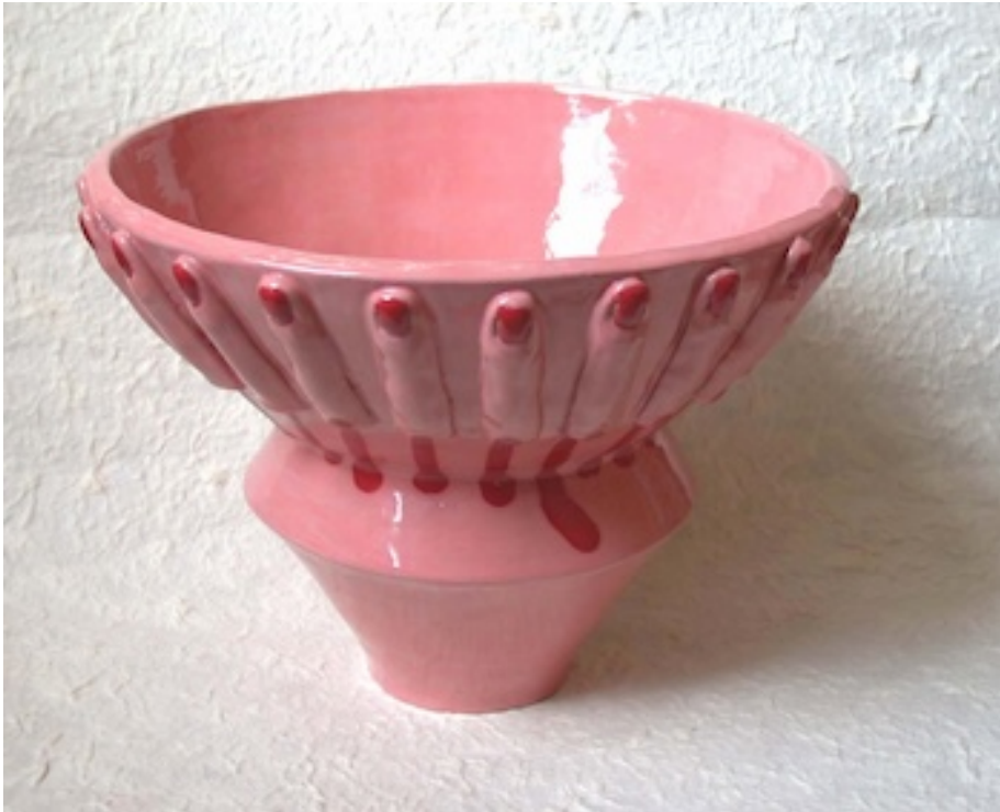
BLOEDENDE VINGERS (Bleeding Fingers) 2007