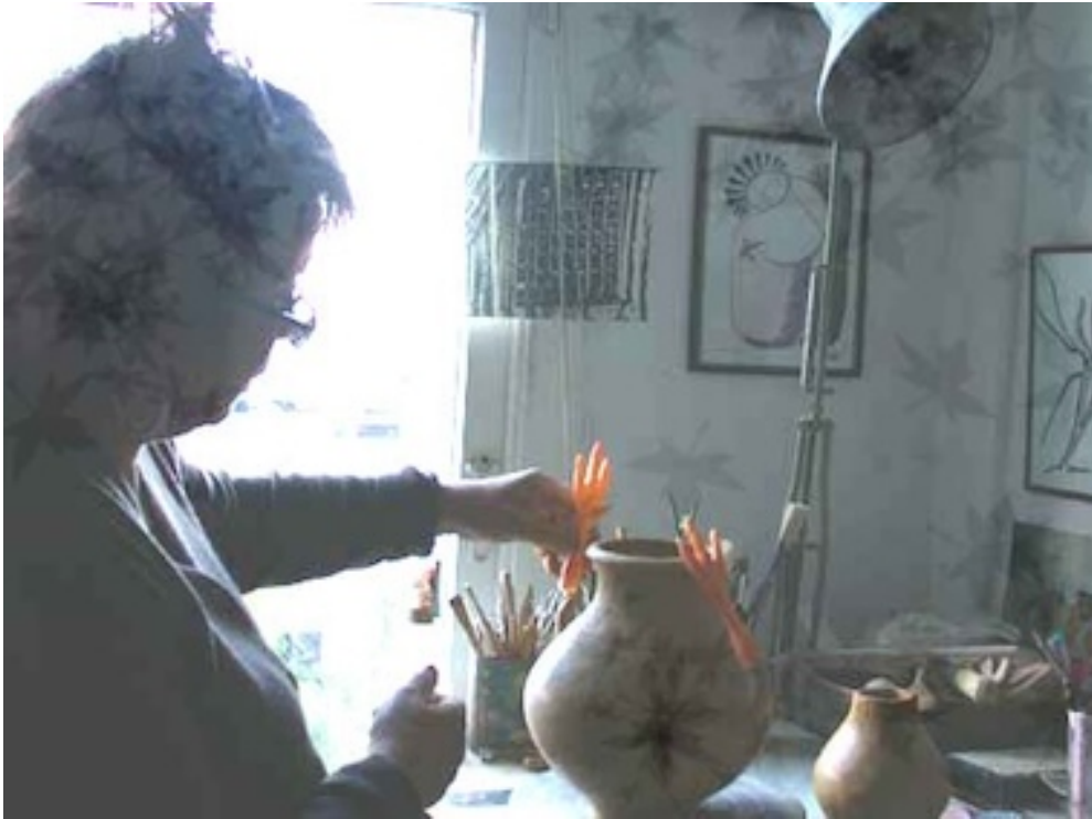
Atelier Rozengracht Amsterdam 2001