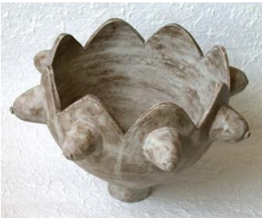
MOEDERMELK (Mother Milk) 2003