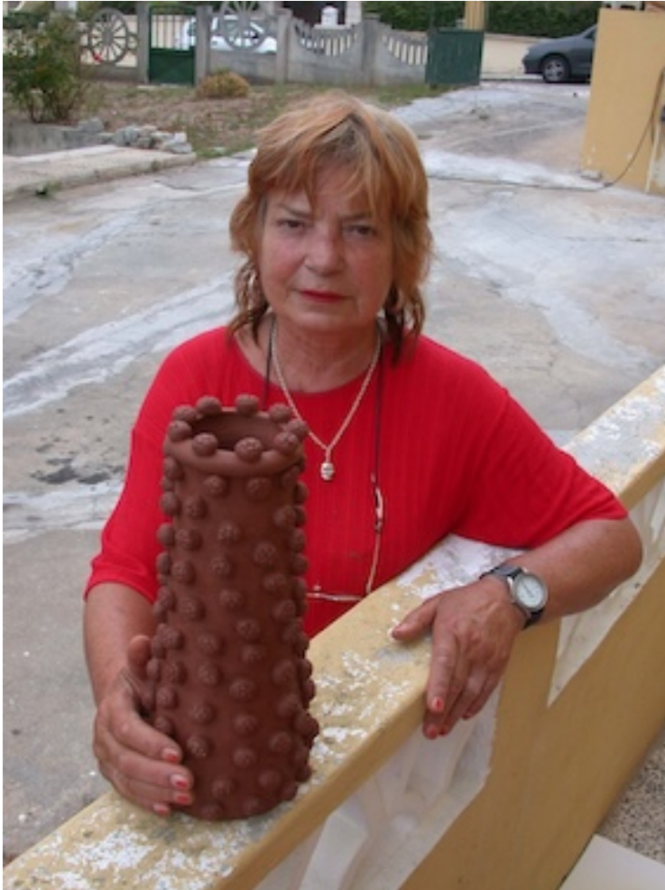
Atelier Buarcos, Portugal 2010