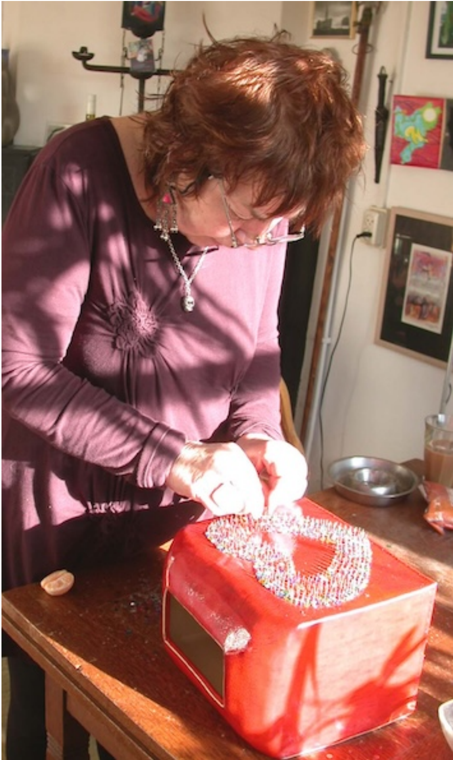
Atelier Rozengracht 2008 with Erzuli