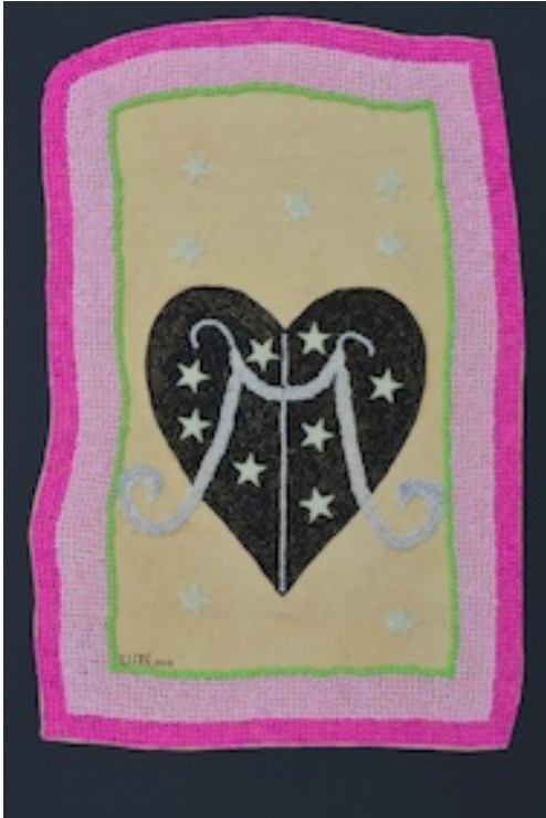
VODOU VLAG 2015 SLANG (Snake) 2015