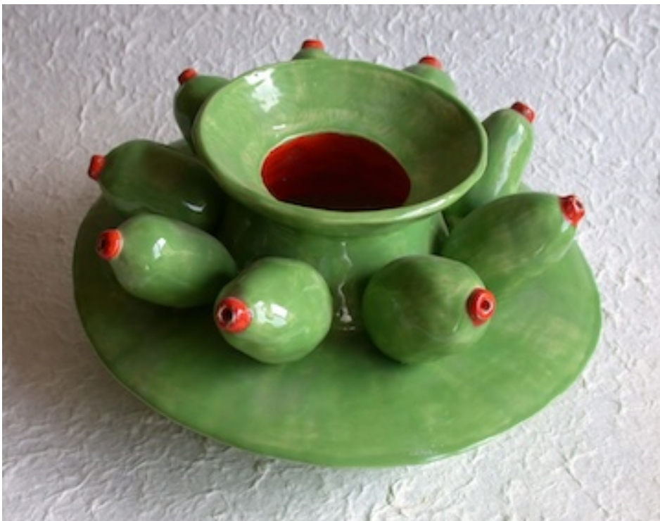
VAMPIER VIJGEN (Vampire Figs) 2007